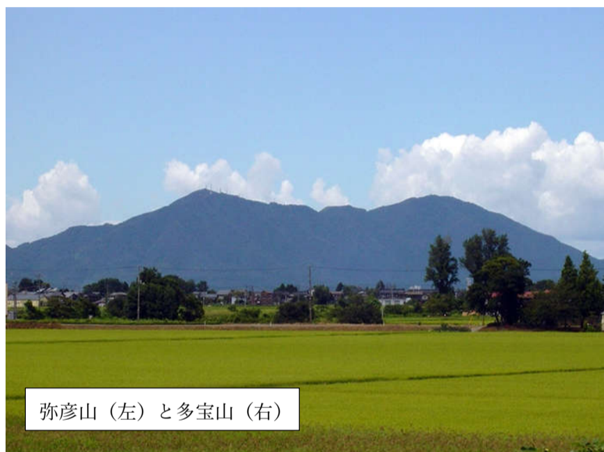
弥彦山 (左) と多宝山 (右)

西蒲原郡彦根村と長岡市の境界にある634mの山でスカイツリーと同じ高さの山としても知られています。